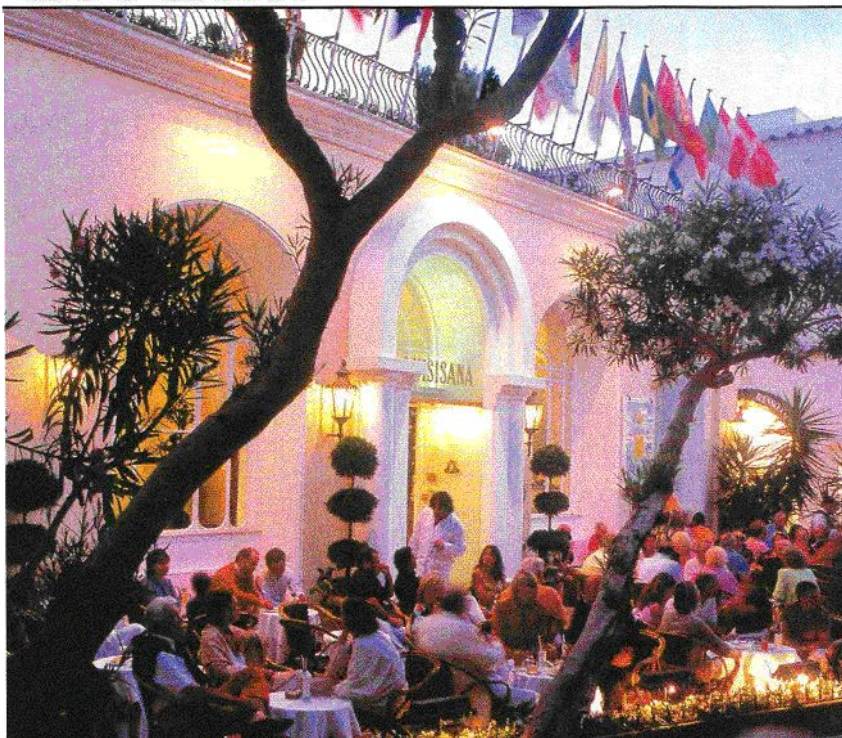
DOLCE VITA La terrazza bar del Quisisana e, sotto, l'interno della boutique con i prodotti della linea Quisi Sport,