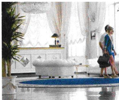
PANORAMICA Un particolare della Penthouse, super esclusiva suite del lussuoso albergo di Capri. A destra, due ospiti attraversano l'elegante hall dell'hotel.