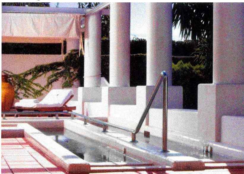
Sopra: percorso acquatico nella Capri Beauty Farm.